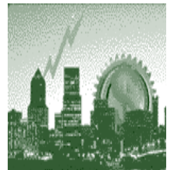
Verzekeringscontracten worden opgezegd door de ramp in Amerika

In principe zijn de prijslijsten van Avenant steeds 1 jaar geldig. Alleen tussentijdse wijzigingen in wet en regelgeving, die tot prijsconsequenties leiden, kunnen de geldigheidsduur wel beïnvloeden.